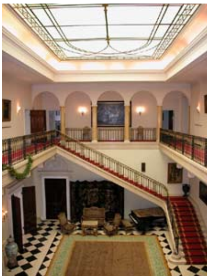
Бели двор, свечани хол са галеријом