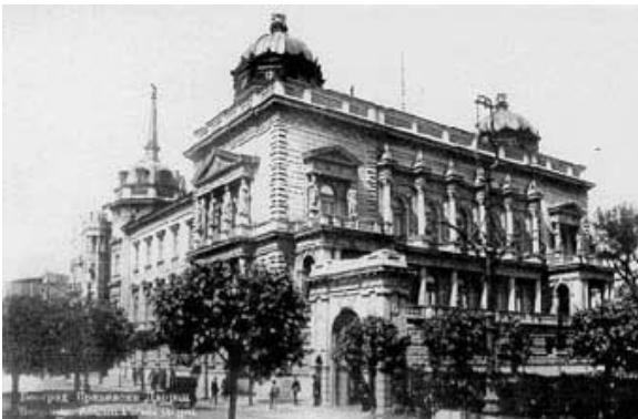
Стари двор, поглед из улице Краља Милана ( у згради се данас налази Скупштина Града Београда)

Резиденција краља Петра I Карађорђевића (у периоду 1903-1921) и краља Александра I (1921-1922) био је Стари Двор који је подигао краљ Милан Обреновић у периоду 1881-1884 (данас Скупштина Града). Ову је зграду у духу академизма и са ренесансном декорацијом пројектовао Александар Бугарски. То је веома репрезентативно здање, које су првобитно красиле и две велике куполе са позлаћеним крунама на