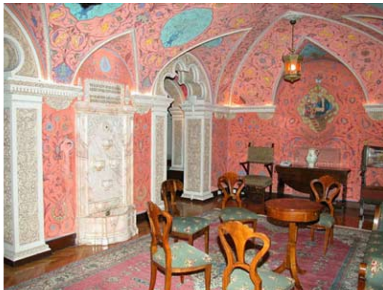
Оријентални или Чаробни салон