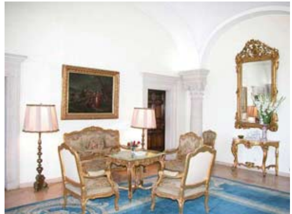
Плави салон Краљевског Двора

На првом спрату, око великог хола такође украшеног копијама фресака из Сопоћана, распоређене су приватне просторије, низ апартмана у којима живе Њихова Краљевска Височанства Престолонас-ледник Александар II, Принцеза Катарина, Принц Наследник Петар и Принчеви Филип и Александар, и који су опремљени у разним стилевима, најчешће Луј XVI, ампир, Наполеон III и бидермајер. У поткровљу су мањи гостински апартмани и помоћне просторије. У сутерену су репрезентативне просторије опремљене у стилу кремаљског Теремног дворца, са сводовима и зидовима осликаним и декорисаним мотивима из бајке о жар-птици и мотивима из српских народних песама. Отуда и назив највећег салона - Чаробни. Ту се налазила и винотека и биоскопска сала.