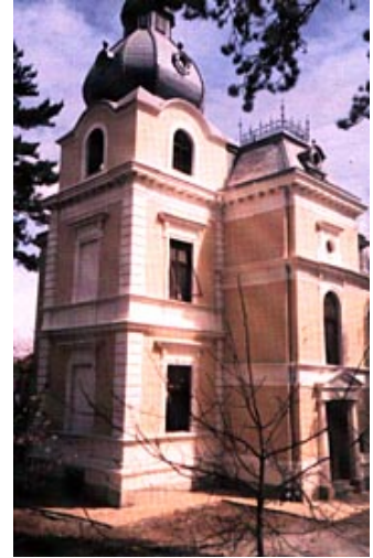
Вила испод топчидерског брда

Услед разарања у I Светском рату, оштећене зграде Градских Дворова нису могле бити коришћене, а поправка је трајала неколико година. Зато су привремено коришћени други објекти. Тако је кућа Крсмановића на Теразијама у Београду била привремена Резиденција Престолонаследника Александра 1918 -1919. године, и у њој је проглашено уједињење Јужних Словена у Краљевину Срба, Хрвата и Словенаца. Једна друга мања вила испод Топчидерског брда коришћена је као привремена резиденција Краља Петра I, који је у њој и умро 1921. године.