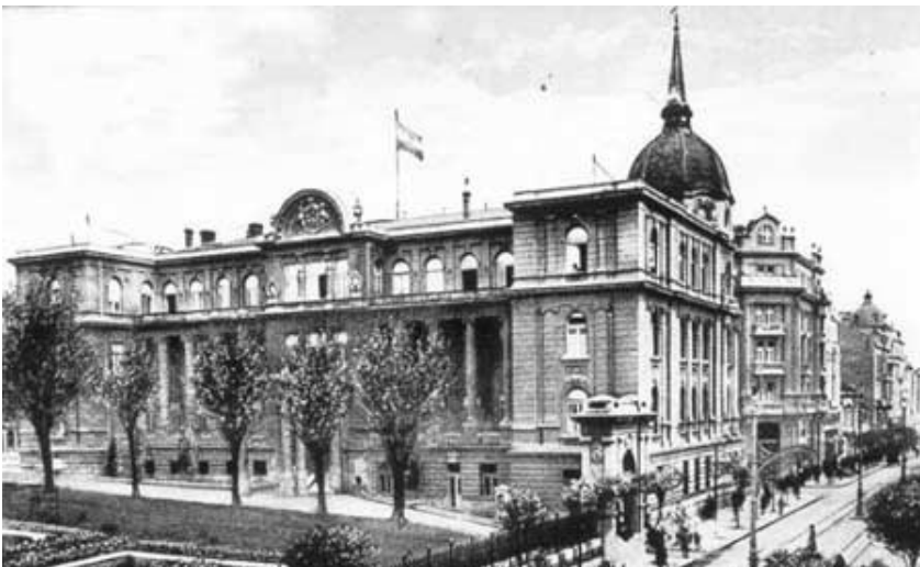
Оригинални изглед Новог двора ( у згради се данас налази Кабинет Председника Републике Србије)

Нови Двор је грађен у време Балканских ратова и I Светског рата, 1913.-1918. године. Пројектант је био Стојан Тителбах, а зграда је у рату била тешко оштећена, тако да се морала темељно реконструисати пре него што је званично и започето са њеним коришћењем. Двор је усељен 1922. године, и од тада до довршетка Краљевског Двора на Дедињу у њему се налазила официјелна резиденција Краља