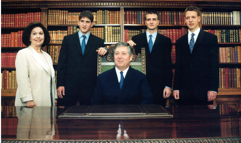
Краљевска Породица у Краљевом Кабинету у Краљевском Двору

(С лева на десно: Њ.К.В. Принцеза Катарина, Њ.К.В. Краљевић Александар, Њ.К.В. Престолонаследник Александар II, Њ.К.В. Принц Наследник Петар и Њ.К.В. Краљевић Филип )