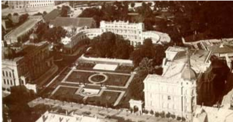
Комплекс градских дворова пре бомбардовања 1941: лево је Стари двор, десно је Нови двор, а између објекат Маршалата Краљевског двора и просторије гарде